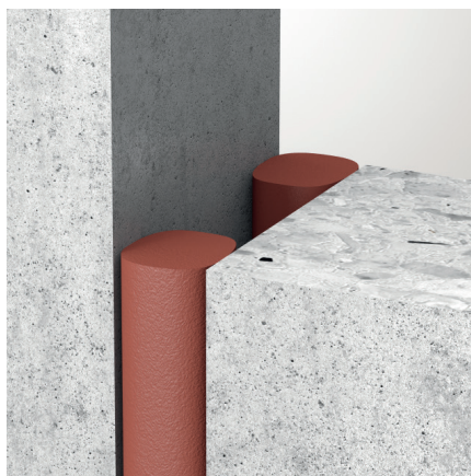
Beidseitige Installation von ZZ® 530