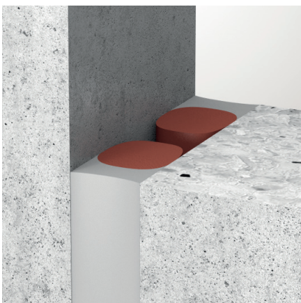
Beidseitige Installation von ZZ® 530 mit Silikon als Hochbaufuge