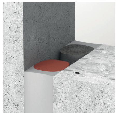
Kombination von ZZ® 530 und Abdichtungsmasse