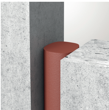
Einseitige Installation von ZZ® 530

In Abhängigkeit der gewählten Montagevariante können Brandschutzfugen bis zu einer Fugenbreite von 75 mm errichtet werden, ZZ® 530 ist hierfür in den Durchmessern 16 bis 80 mm erhältlich.