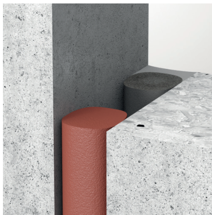
Kombination von ZZ® 530 und Abdichtungsmasse